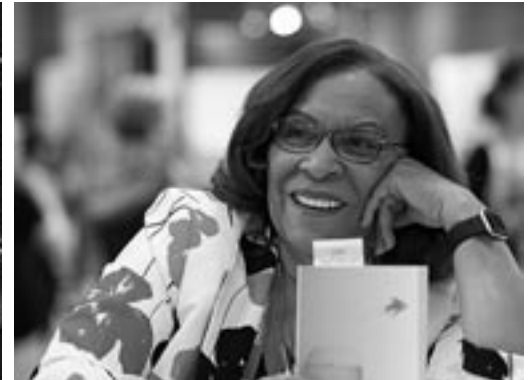
Inglise romaanikirjanik Alice Peterson oma raamatuga By My Side (Minu kõrval), 2012