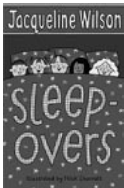
Jacqueline Wilson, inglise novellist ja lastekirjanik