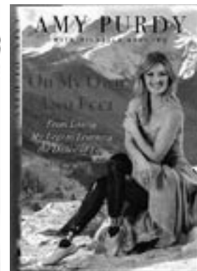
Amelia (Amy) Purdy on Ameerika näitleja, modell, para-lumelaudur, kirjanik, disainer...