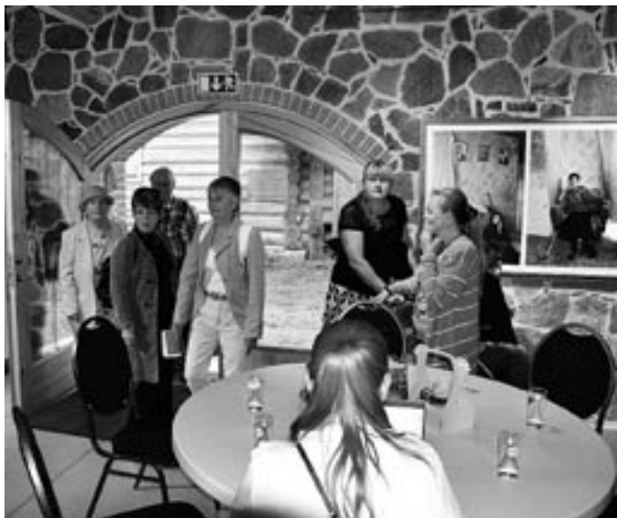
Üldkoosolekule saabuvad võtavad koha sisse Setu talus