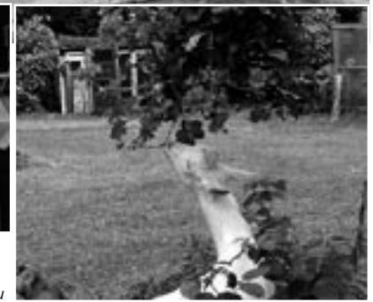
Talumajapidamise “päris elu” – jänesed, hobused, kitsed, kuked-kanad-pardid on see, mis linliku eluviisiga inimesi enim huvitab